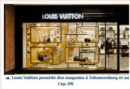
▲ Louis Vuitton possède des magasins à Johannesburg et au Cap.

Mots clés: Afrique Du Sud, LVMH, Maroc, Zegna,