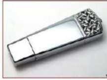
Applied Technology - Virtual Scent