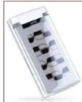
Product Extension & Applied Technology