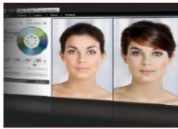
Virtual Dressing & Makeovers