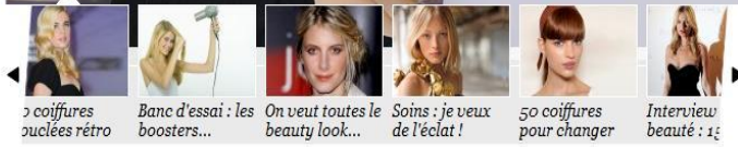
20 coiffures bouclées rétro